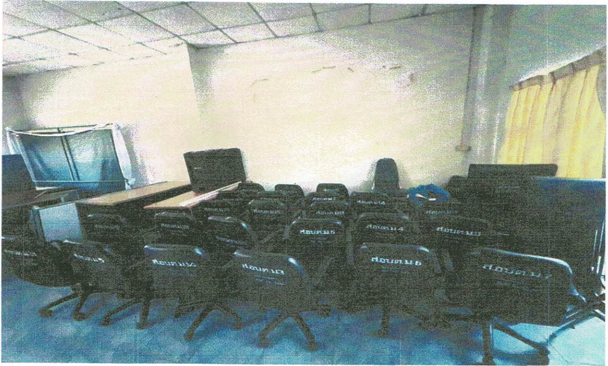
รูปครุภัณฑ์เก้าอี้